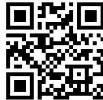
QR-Code zum Download der App „Adventure Lab“