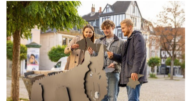
In der Peiner Innenstadt gibt es sieben Rätsel-Stationen der Adventure Tour „Peine Code – Knacke das Stadtgeheimnis“ zu entdecken.

Der Clou: Unter „Details“ finden sich in der App nicht nur die Beschreibung der Rätsel, sondern auch interessante Hintergrundinformationen über Peiner Sehenswürdigkeiten und Persönlichkeiten. So lässt sich Peine aus völlig neuen Perspektiven entdecken – historisch, kulturell und mit lokalem Charakter. Jede der sieben Denksportaufgaben funktioniert für sich allein, auch gibt es keine vorgegebene Reihenfolge. Knobelfreunde haben also die freie Wahl, welche Herausforderung sie wann bewältigen möchten. Kleiner Tipp: Eines der Rätsel