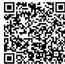
QR-Code für die Adventure-Tour „Peine Code – Knacke das Stadtgeheimnis“