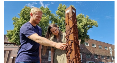
In der Peiner Innenstadt gibt es sieben Rätsel-Stationen der Adventure Tour „Peine Code – Knacke das Stadtgeheimnis“ zu entdecken.