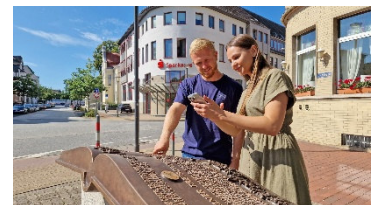
In der Peiner Innenstadt gibt es sieben Rätsel-Stationen der Adventure Tour „Peine Code – Knacke das Stadtgeheimnis“ zu entdecken.