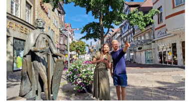
In der Peiner Innenstadt gibt es sieben Rätsel-Stationen der Adventure Tour „Peine Code – Knacke das Stadtgeheimnis“ zu entdecken.

Abdruck honorarfrei – die Verwendung der Fotos ist frei für journalistische Zwecke zur Berichterstattung im Zusammenhang mit dem Inhalt der Pressemitteilung bei Nennung der Quelle.