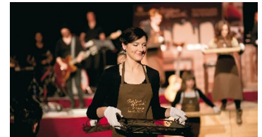
Die Schokoladen-Botschafter servieren während des Konzerts die live auf der Bühne zubereiteten Schokoladen-Pralinen.

Partner der Peine Marketing GmbH sind: Stadtwerke Peine, Funke Mediengruppe, Sparkasse Hildesheim Goslar Peine, Peiner Allgemeine Zeitung, Baustoff Brandes GmbH, Benckendorf Bauunternehmung, Bundesgesellschaft für Endlagerung mbH, Hagen Energiesysteme, Peiner Heimstätte, Rausch GmbH, Volksbank BRAWO, Wohnbau Salzgitter, VGH, Kaufmannsgilde zu Peine, BrauManufaktur Härke, dima Unternehmensgruppe, KreisKurier Peine, Radio 38.