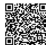
QR-Code: Direkt zum Online-Vorverkauf für die Silent Music Party im Peiner Burgpark.