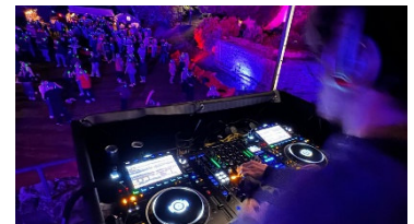
Vom Mischpult in die Kopfhörer: Der Techno Bunker Peine legt als Liveact bei der Silent Music Party auf.