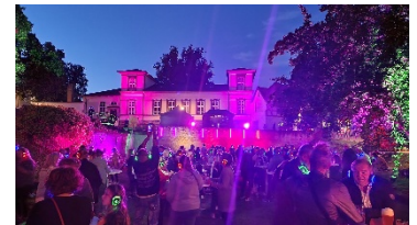
Silent Music Party im Peiner Burgpark: Die zweite Auflage des einzigartigen Events findet am Samstag, 14. Juni 2025, statt.