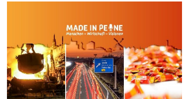
„Made in Peine“: Die Podcast-Staffel legt den Fokus auf den Wirtschaftsstandort Peine.

Hinweis: Aus Gründen der besseren Lesbarkeit wird auf die gleichzeitige Verwendung der Sprachformen männlich, weiblich und divers (m/w/d) verzichtet. Sämtliche Personenbezeichnungen gelten gleichermaßen für alle Geschlechter.