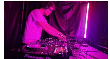
Lokales DJ-Kollektiv: Der Techno Bunker Peine legt bei der Silent Music Party als Live-Act auf.