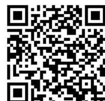
QR-Code: Direkt zum Online-Vorverkauf für die Silent Music Party im Peiner Burgpark.