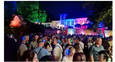
Kopfhörer auf und Musik an: Am Samstag, 6. Juni 2026, steigt im Peiner Burgpark die Silent Music Party.

Partner der Peine Marketing GmbH sind: Stadtwerke Peine, Funke Mediengruppe, Sparkasse